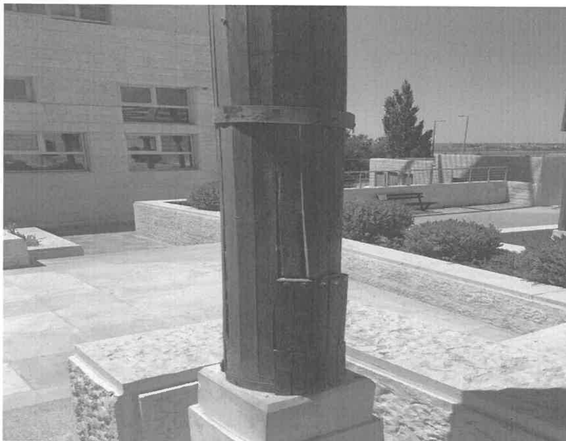
فتحات الصيانة لتمديدات أعمال الإنارة